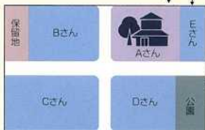
②公共減歩 (道路・公園などの用地にもります)