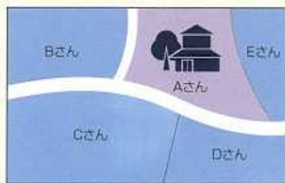
Aさんの整理前の宅地