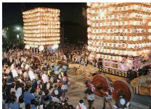
伏木神社春季例大祭の祭礼行事

近世には、瑞龍寺や勝興寺に見られるように加賀前田家や本願寺などによる大規模な伽藍整備が行われる一方で、経済力を増した民衆の寄進により寺社の造営がなされた。また、信仰と深く結びついている祭礼行事は、民衆の生活と密接に結びついて多彩な変容や広がりを見せ、現在も集落など様々な規模のコミュニティで執り行われている。