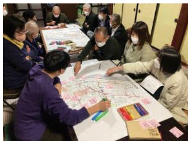
サインチーム活動の様子

事前調査とサインチーム活動での議論から、地域全体に存在する吉久の魅力や電停から重伝建までの道のりの分かりにくさ、一部の地域住民しか正確な歴史情報を知らないことが見えてきました。