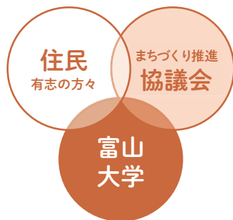
サイン計画の体制