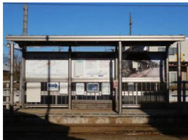
新吉久駅の既存サイン

サインとは、人々を案内するための看板のことです。吉久は、令和2年に重要伝統的建造物群保存地区（重伝建）に選定されたことで、 それ以前に設置された新吉久駅のサインの情報を更新する必要性が高まり 、今回の吉久サイン計画が始まりました。それに際して、来訪者により快適に吉久を来訪してもらうために、吉久全体のサイン計画を行う運びとなりました。