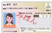
マイナンバーカード

そのほか ・パスポート ・障害者手帳 ・官公署発行の顔写真付き免許証、許可証など