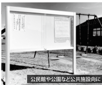
公民館や公園など公共施設向けに