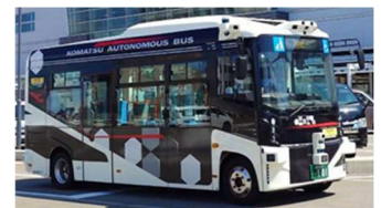
次世代バス（イメージ）

有識者、交通事業者、各種団体代表らとともに、行政が主体となって、路線バス等の再構築の実現に向けたデータ収集・分析、ロードマップ作成や運行事業の共同化・協業化に向けて検討を行う。