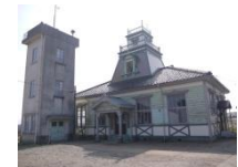
伏木気象資料館 (旧伏木測候所)

旧伏木測候所の遺構である伏木気象資料館において、現在失われている望楼の復元を中心とした保存修理を実施した。