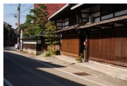
旧菅笠問屋と町並み

旧北陸道には、特産品の集散地として発展した郷町があり、中でも、菅笠づくりで栄えた福岡町は、かつての菅笠問屋である伝統的な町家とともに、歴史的な風情を醸し出している。