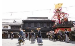
高岡御車山と山町筋

開町以来の商人町である山町には、豪華絢爛な高岡御車山(祭)が守り伝えられ、山町筋の重厚な土蔵造りの町並みと相まって、壮麗かつ端正なたたずまいを醸し出している。