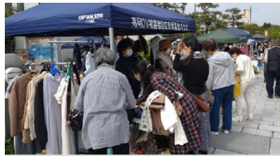
2023.5.1 八丁道 おもしろ市

センター相談員を通じて生活に困窮しているDV被害者に、支援金の無利子貸付や無償提供、その他生活必需品の提供や家事支援などを行っています。年2回、有志の皆様と共にフリーマーケットにも参加し、活動の輪を広げています。皆様のご賛同、ご支援をお願いします。