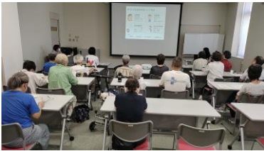
Eフェスタ2025ワークショップの様子