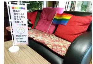
居場所「みちくさ」のお部屋の様子