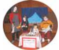
中田かかし祭り 「みんなで協力、楽しい子育て」の展示

今年のテーマは「楽しい子育て」。『ちょっとできる男女平等・共同参画』という視点で、子育てに関する意見を家庭、職場、地域・学校の部門別に募集しました。(総応募数 140 件)