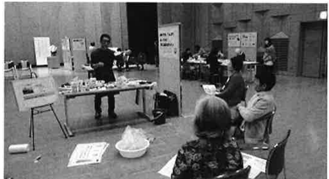
お家の汚れ、どうしたらキレイになる？ プロに秘訣を教わろう！