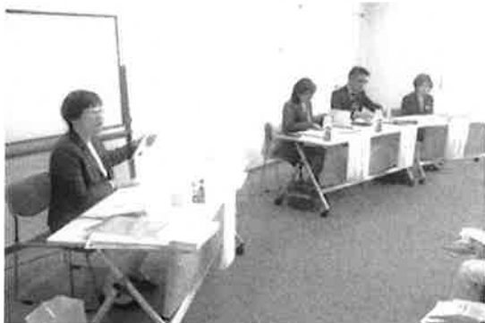
富山市・飛騨市・高岡市連携事業 「お隣さんの男女共同参画」