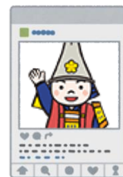
Photo Corner 写真コーナー

高岡市公式Instagramを開設しました。みなさんが通勤・通学やお出かけの際に見つけた、ちょっと自慢したい(自分の推し)高岡の街並みや自然、風景、歴史、伝統、食文化などの写真をご自身のアカウントに、「#高岡み〜つけた」または「#高岡みーつけた」とつけて投稿してください。その写真を市公式アカウントでリポストします。