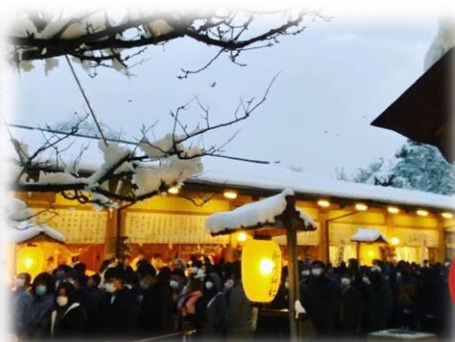
② 初詣@射水神社 Hatsumode at Imizu Shrine