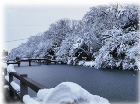
① 古城公園の雪景色 Kojo Park's Snow Scenery