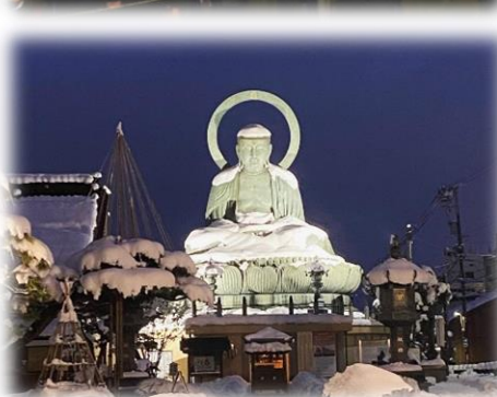
④ 雪マント・高岡大仏 The Great Buddha's Winter Coat