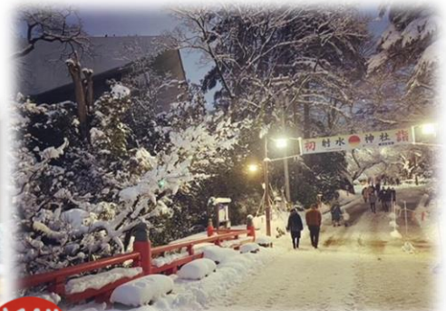
③ 新年を迎えて Celebrating the New Year