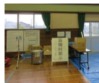
総合防災訓練での展示

横田校下自主防災組織連絡協議会がコミュニティ助成を受け、避難生活に必要な資機材を購入しました。今年度の総合防災訓練で住民の皆さんにお披露目をしました。今後は購入した資機材を利用して校下単位での防災訓練を行う予定です。