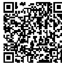
ハザードマップ (市 HP)

今年4月に災害対策基本法が改正され、5月20日から新たな避難情報の運用が開始されました。従来の避難情報では、必ずしも的確な避難につながっていないとして、避難するタイミングがより明確な表現に見直されました。今回の見直しを踏まえ、改めてお住まいの地域の災害リスクや避難行動、非常持出品をハザードマップやマイ・タイムラインなどで確認し、 警戒レベル4『避難指示』の段階までに必ず避難 できるよう準備しておきましょう。