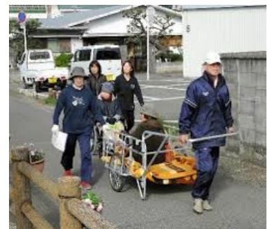
■リアカーを活用した搬送訓練の様子

★市ホームページに自主防災組織訓練マニュアルを掲載しております。 詳しくは高岡市自主防災組織訓練マニュアルで検索！