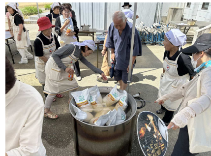
■炊き出し訓練の様子