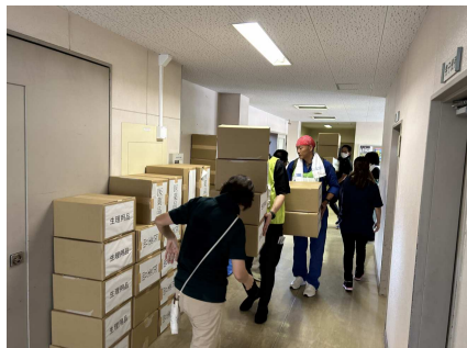
■緊急物資受入訓練の様子