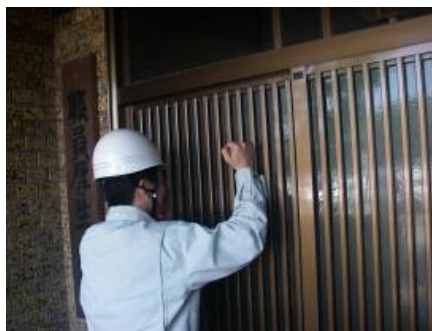
■避難の際は隣へ声をかけて避難