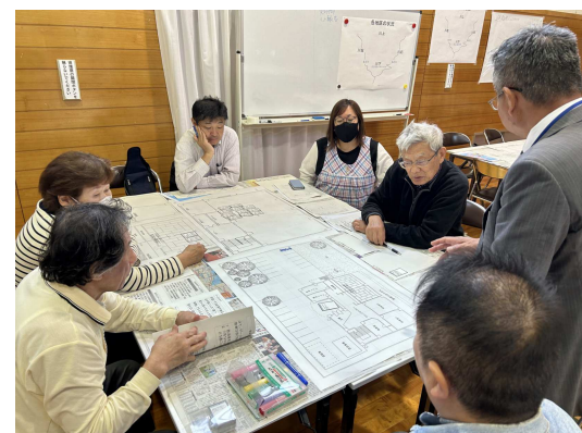
■HUGの様子（川原公民館にて）

https://www.city.takaoka.toyama.jp/kikikanri/bosai/bosai/sonaeru/chiiki/news.html