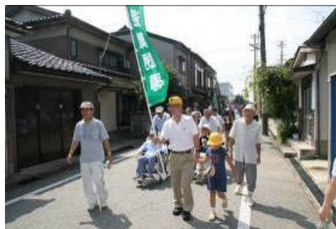
■避難誘導訓練の様子