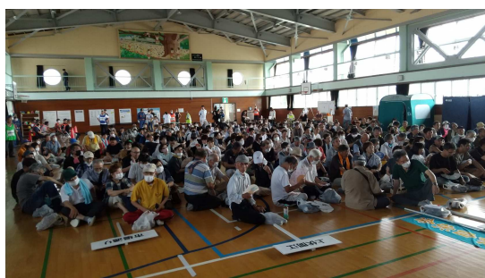
■避難訓練の様子（二塚小学校）

参加対象 下関校下自主防災組織連絡協議会、野村地区自主防災組織連絡協議会、二塚校下自主防災組織連絡協議会、野村防災士会【参加者 各会場約300名】