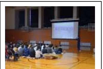
守山地区 防災訓練