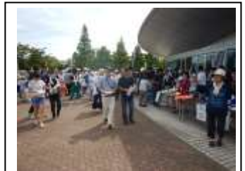
富山県総合防災訓練

参加対象 高岡西部中学校区各自治会 国吉中学校区各自治会【参加者数 2,254 人】