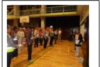
避難所運営実地訓練 (西条モデル)