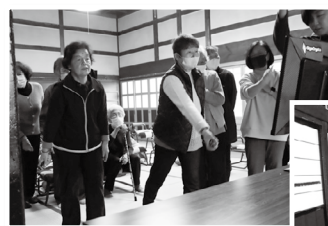
◀通いの場でのeスポーツ体験の様子