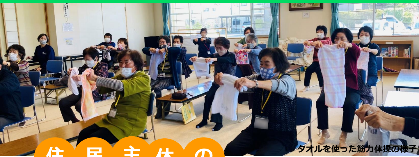
タオルを使った筋力体操の様子