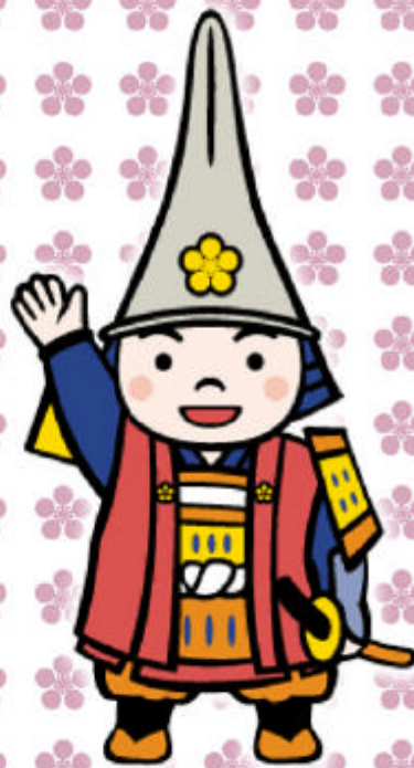
マスコットキャラクター 利長くん