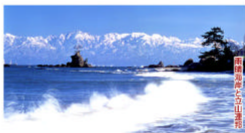
雨後海岸と立山連峰