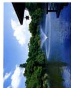
高岡古城公園 (高岡城跡)