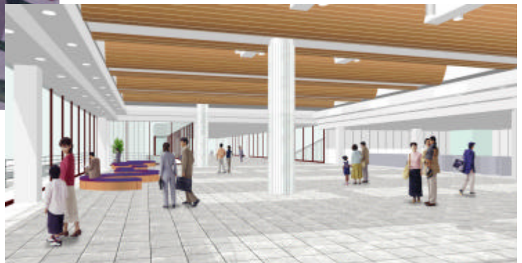
南北自由通路内観 イメージ