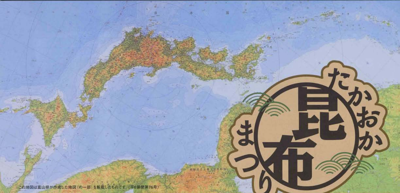
この地図は富山県が作成した地図(の一部)を転載したものです(平6第便第76号)