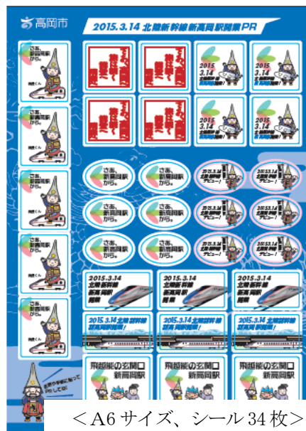
<A6 サイズ、シール 34 枚>