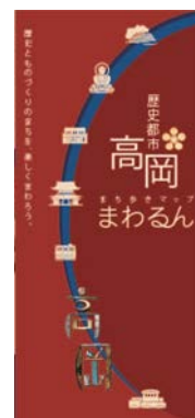
歴史都市高岡まち歩きマップ まわるん