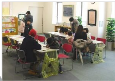
親子で楽しく、オープントースターで作るフタバキーホルダーに挑戦!

高岡市では「認めあい 支えあい 共に輝く ひととまち」を目指して、男女平等・共同参画の視点(参画・地域・両立・男性・DV・推進)で様々な事業を展開しています。今回は、『両立・男性』を視点に、お父さんやおじいちゃんが、お子さんお孫さんと一緒に作る楽しい工作教室を開催しました。