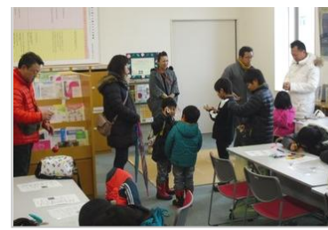
けん玉、めんこ、こまもあるよ。おとうさん、上手なやり方おしえて!