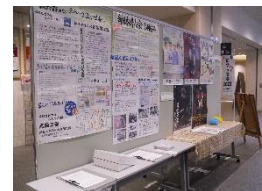
令和4年度のパネル展示