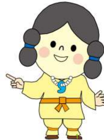
まがたん (高岡市埋蔵文化財センターキャラクター)

赤くなっているところが、遺跡などの文化財のあるところだよ。高岡市にはこんなにたくさんの遺跡があるんだね。