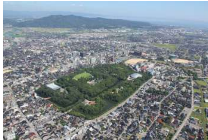
高岡古城公園【国史跡高岡城跡】