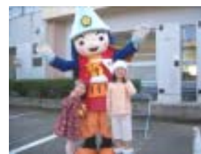
利長くんもお出迎え