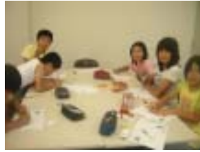
ランチョンマット作り