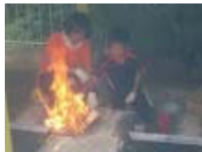
火起こしも手馴れたもの！