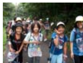
山寺まであと少し