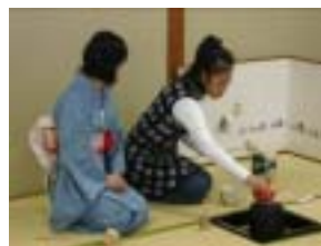
最後のおさらい会では、お点前を披露しました