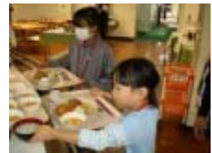
自分で準備をします