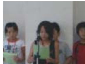
6日間の思い出を発表しました

昨夜書いた感想文をもとに、6日間の思い出を一人ひとりが発表した。また、迎えに来られた家族に感謝の手紙も渡した。そして、一人ひとりに修了証を手渡し、本事業を終えた。