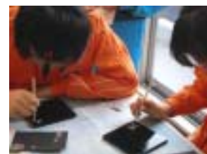
切り取った貝を貼り付けます