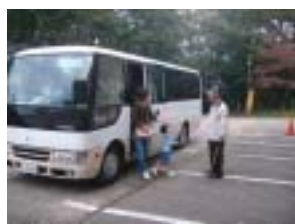
シャトルバスで到着

また、当館正面玄関前に総合受付を設け、来場された方に各種体験ブースの説明や予約、フードコートのお券販売などを行った。