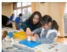
親子で頑張ってます

講師の先生方と相談の上、紙粘土を使って作るものとした。また、今回の参加者の多くが親子であったため、親子で 1 組のひな人形を作ることにした。実際の活動では、親子で仲よく協力をして作っている様子がうかがえた。