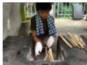
かまどの仕事も責任重大