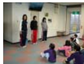
ボランティアさんありがとう