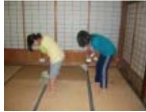
まずは、掃き掃除から