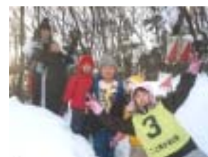
ハイキングの様子

普段は、なかなかこのような雪深い中で遊ぶことができない子ども達にとって、とても印象に残る活動になったようである。