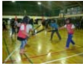
スポチャンの練習

本格的な活動の始まりということで、最初は多少硬い顔をした参加者もいたようだが、活動が進むにつれて参加者の笑顔が見られるようになってきた。