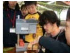
芯を入れる穴は慎重に