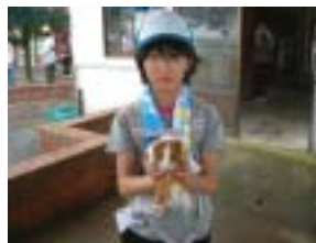
モルモットをだっこ

この日は、気分転換も兼ねて、稲場山牧場へ出かけた。ここでは、実際に大きな牛を見たり、ウサギやモルモットなどの小動物ともふれあったりなどして、気分をリフレッシュさせた。