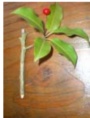
Only One の色えんぴつ