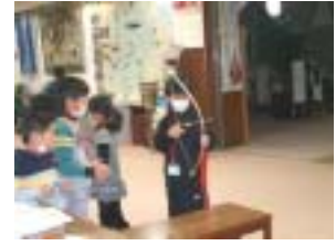
弓矢はできるかな