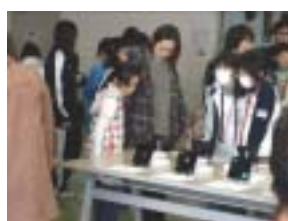
きれいにできたね！

保護者を交えて作品の鑑賞を行った。その後、一人ずつ作品を紹介し、作品名や頑張ったところ、工夫したところなどを発表した。また、発表中は発表者の作品をスクリーンに映し出し、みんなによく見えるよう工夫した。