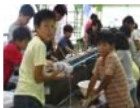
洗濯板とたらいで洗います

この事業では、身の回りのことができるようになることも一つの目的となっている。この洗濯の活動では、自分の着たものを自分自身で洗うことによって、普段の生活の便利さを感じ、また、生活の仕事の一部を体験することになる。