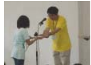
館長から修了証を手渡します