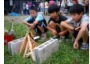
いよいよ夕食作り