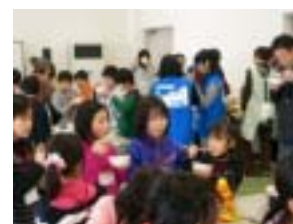
おいしくいただきました