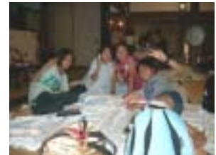
みんなで雑魚寝します