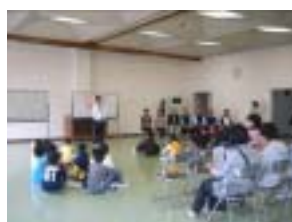
後期クラブの開講式