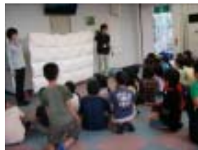
たたみ方の説明中

ベッドメイキングと同様に、実際の布団を使ってたたみ方を説明したり、清掃やまとめた荷物の置き場所などを指示したりした。