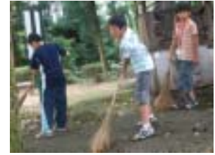
明日に備えて掃き掃除