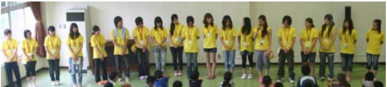
最後に、お世話になった学生ボランティアさんの一人ひとりから、一言ずつお話をしてもらいました