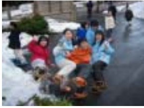
かんじきをはきました