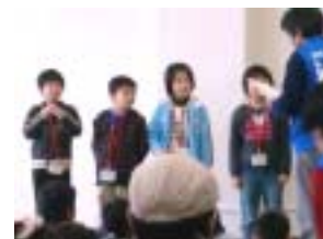
よく頑張りましたね！