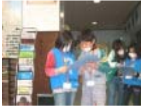
今はどこなのかな