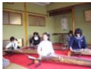
まなびっこフェスティバルやおさらい会では、曲目の演奏をしました