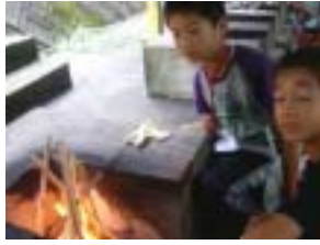
火起こしはばっちり？