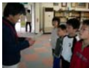
一年間よく頑張りました

本事業は、定例クラブ「まなびっこクラブ」の閉講式も兼ねている。各クラブ員には修了証を授与し、この1年間のクラブをやり遂げたことを賞した。その後、副館長の挨拶やボランティアのみなさんから一言ずつ言っていただき、本事業を終了した。