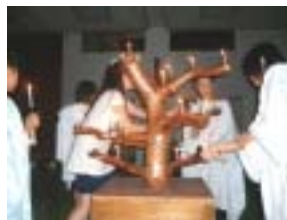
大燭台に灯します

ボランティアの皆さんに企画・運営をお願いし、実施した。参加者にとってもボランティアにとっても、楽しいひと時を過ごす良い機会となった。