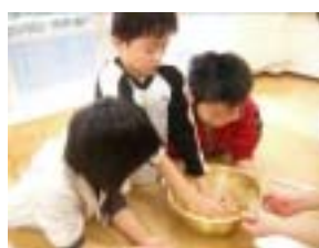
頑張って作ります

本事業は、3つの大きな活動を設けている。クラフト活動、野外活動、そしてこの料理活動である。今回は、当館で人気のメロンパン作りに挑戦した。参加者は、それぞれに役割を分担し、思い思いの模様を付け、活動を楽しんでいた。