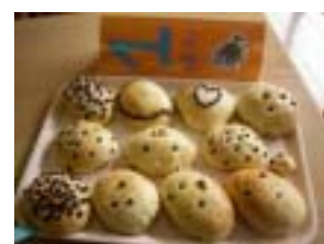
焼きあがったメロンパン