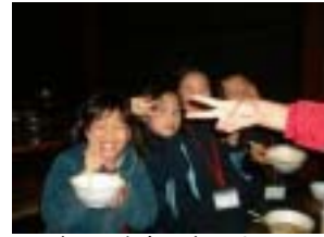
とってもおいしいよ！