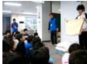
実際の布団を使って説明

荷物整理、ベッドの復元、清掃を行った。ベッドの復元に関しては、実際の布団を使って説明を行った。ベッドメイキングと同様に、時間はかかったものの、自分の力で最後まで行わせた。