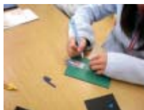
集中して貝を切ります

貝はりでは、にかわを使って貝を接着する作業(貝はり)を行った。ボランティアも子どもたちからの問いかけに優しく答え、子どもたちの作業能率も上がったように思われた。