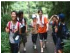
今度は海を目指します！

この日は、二上山を下りながら、海までオリエンテーリングを行った。約2時間30分のコースを設定し、各班でゴールへ向かった。途中のチェックポイントでは、ゲームなどの課題を設けた。子ども達は、暑さと疲労感を感じながらも、一生懸命にゴールを目指した。ゴール後は、食事を取って、海水浴を行った。海水浴では、体全体を使って思いっきり楽しんでいただいていたようであった。