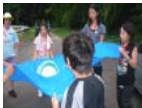
パケッツボールをしました