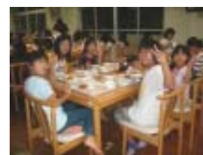
おいしく食べてます