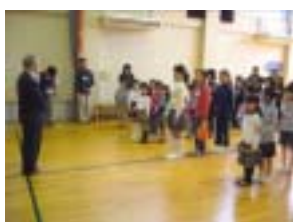
通年クラブの開講式

本事業は、定例クラブ事業として、各教室の総称を「まなびっこクラブ」と改名し、その中に各クラブを設ける形をとった。また、児文セで実施されていた教室に加え「パソコン」教室を開講し、年間およそ 15 回の教室を設け、約 100 名のクラブ員で、新たにスタートを切ったものである。