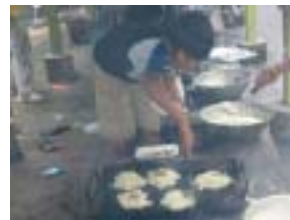
お好み焼きができていきます