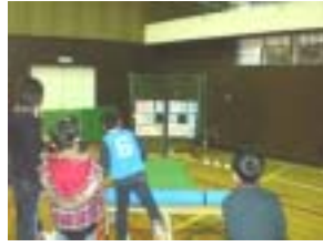
ストラックアウトに挑戦