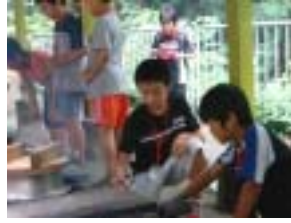
お釜でご飯を炊きます