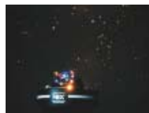
ドームの中の様子