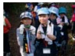
笹舟も作りました