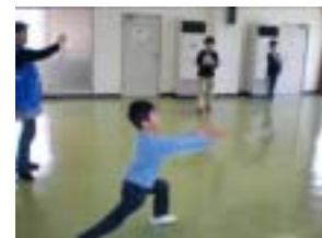
飛ばしてみました！