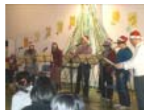
コーラスグループ「CAM」さん