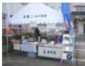
開町 400 年記念グッズの販売