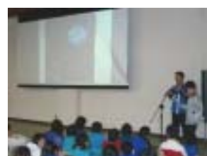
一人一人、発表しました