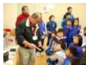
こうやって塗るんだよ

次の上塗り作業では、はけの扱い方、塗り方を丁寧に指導していただき、子どもたちも心を落ち着けて上塗りに取り組んでいたようだ。