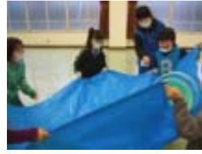
バケツボールも行いました