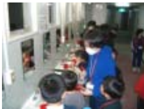
活動の前後はうがい・手洗い

初めての宿泊体験者が多いということで、実際の布団を使って説明を行った。説明後、実際にベッドメイキングを行ったが、“友だちと助け合う”ということ掲げ、取り組ませた。そのため、部屋の仲間と一緒に協力をしながら行えていたようである。中には、スタッフの手を借りながら行っていた参加者もいたが、子ども達同士の絆、子ども達とスタッフとの絆を作ることにつながったように思われる。