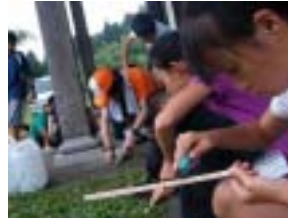
自分専用の箸を作ります