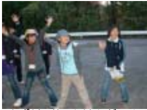
まずは、じゃんけんゲーム

今回の野外料理では、食材の選択から調理方法に至るまで、参加者自身で行うことにした。食材の選択については、ゲームを取り入れながら、各班で食材選びを行った。その後の調理では、思い思いの鍋に仕上げていたようである。