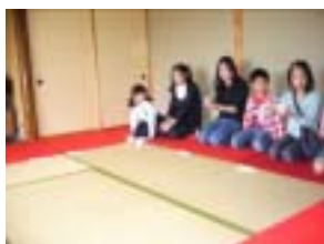
茶道ではお手前を披露