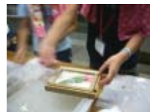
なかなかのできばえ！