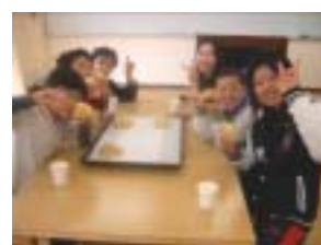
おいしくいただきまます