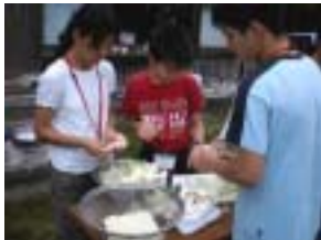
野外炊飯は、もっお手の物です！