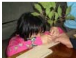
集中して芯を入れます