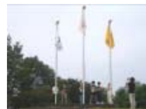
しっかりと揚げられました

朝のつどいでは、旗(国旗、市旗、館旗)の掲揚を行う。当館の掲揚塔は、ポールにロープをつけてある単純な形のものです、どの場所でも生かすことができ、今後の参考にもなると思い取り入れている。