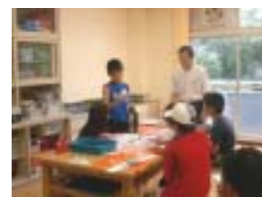
僕の発明品は「しおり」