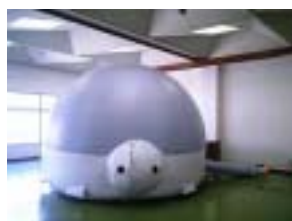
簡易型プラネタリウム

当館にある簡易型プラネタリウムの上映会を行った。秋の星空を見ながら、星空学習をしてもらった。なお、午後から 4 回の上映を行い、延べ 60 人を超える方に見てもらった。