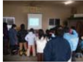
冬の二上山の上映