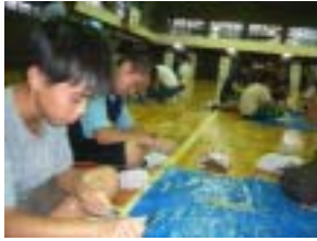
竹はしも頑張って作ります