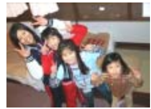
みんなができたよ！