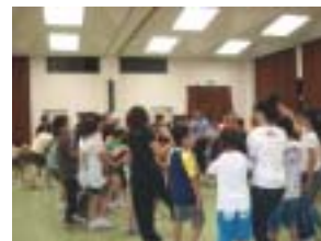
みんなでマイムマイム