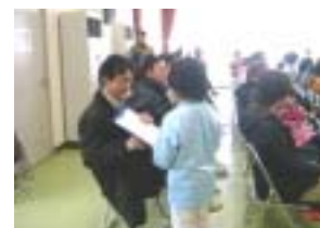
アンケート記入の様子