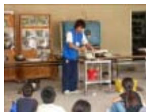
野外料理の説明中

説明や実際の活動中も、指導員やボランティアで目を配りながら、なるべく参加者自身で行わせ、達成感や充実感を味わうことができるように進めていった。