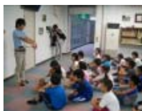
準備の仕方を説明中

食事の準備の仕方などの事前指導を行ってから、班ごとに食堂に入らせた。参加者の中から代表して合掌する人を選び、少しでも子ども達で行っているという意識を持たせた。