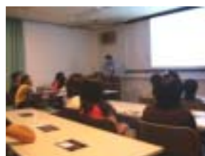
館内での星空学習

富山県天文学会の方々を講師としてお招きし行った。天体望遠鏡を持参していただき、木星、月、こと座のベガ、わし座のアルタイルなどを見せてくださる予定だったが、天候に恵まれず、星の観察は十分に行えなかった。しかし、館内では、すばらしい天体の映像を見せていただいた。