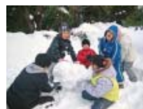
雪だるま作りの様子