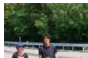
ちゃんと飛びました！