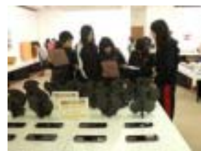
こんな作れるのかなぁ

また美術館では、市内の小学5、6年生と中学1年生が取り組んでいる「ものづくり・デザイン科」