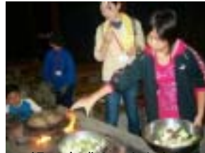
鍋の完成まであと少し