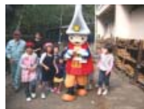
利長くんも気になります