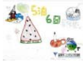
作成したランチョンマット