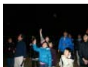
みんなで星空を眺めます