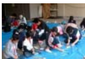
うまく削れているかな？

竹とんぼを作り終えた参加者は、実際に飛ばしてみても楽しんだり、改良を加えたりなどしていた。また、竹はしを作った参加者は、昼食時に使えるよう煮沸消毒をし、野外料理に備えた。