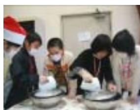
生クリームも作ります

クリスマスといえば、クリスマスケーキということで、ケーキ作りに挑戦した。各班、思い思いのデコレーションを楽しんでいたようである。