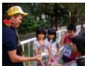
外にもチェックポイント

今回は、男子の応募が少なく、また班で男子が1人という班もあり、良好にコミュニケーションが取れるのか心配していたが、各班に入ってくれたボランティアの支援もあり、スムーズに班活動を行えたようであった。