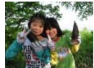
竹の子も見つけたよ