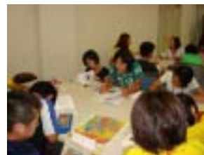
招待状作りの様子