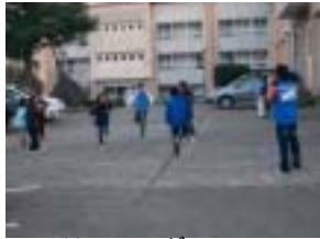
リレーで、ダッシュ！