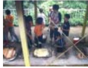
みんなで協力して作ります