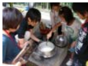
みんなで協力しました