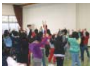
アイスブレイキングの様子

「なかよし合宿」のめあて 1．自分のことは自分でしましょう！ 2．次に使う人のことを考えましょう！ 3．時間を守りましょう！（５分前行動）