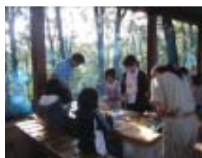
各班に分かれて作ります

このクラフト活動では、自分達で調理用具を作 ることを目的としており、調理にも使え、また食 事中、更には家庭に帰ってからでも使えるものとい うことで、「竹はし」とそのはしを入れる「はし袋」 を作ることにした。