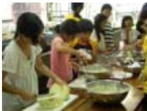
まずは、食材の準備

本年は、お好み焼き作りに挑戦した。この食事会で準備する食事数は、160人分ほどにもなる。各班内で役割を決め、食材を準備する者、かまどで火を担当する者に分かれ、準備に取り掛かった。最終日もなると、班員同士の協力関係も築け、また野外炊飯に関しても馴れた手つきで、順調に準備を進めることができた。実際の会食では、参加者とその家族、そして各班を担当していたボランティアとで、この6日間を振り返りながら時間を過ごすことができた。