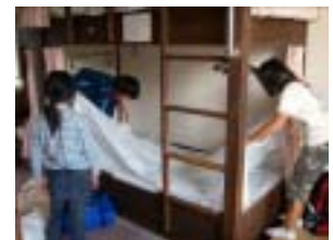
頑張ってベッドメイク