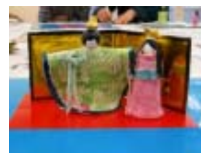
できあがりでした！