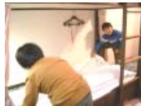
協力してベッドメイキング