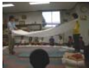
実際の布団を使って説明

初めての宿泊体験者が多く、また本事業の目的の一つでもある「次年度の宿泊学習の準備」を考え、入念な説明を行い、自分自身でできるように配慮した。