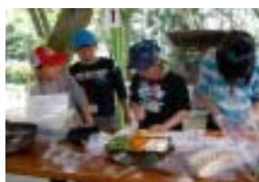
竹の子料理に挑戦！

本事業は「春」をテーマにしていることから、春の食材を使った野外料理を毎年行っている。当館の周辺には竹林もあり、「竹」に親しむ環境が整っていることもあり、竹の子料理を行っている。本年度は、恒例となっている竹の子ご飯に加え、竹の子の炒め物と味噌汁も作り、竹の子づくしの野外料理となった。