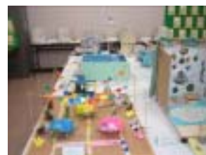
作品展の優秀作品