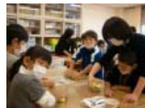
みんなでこねこね