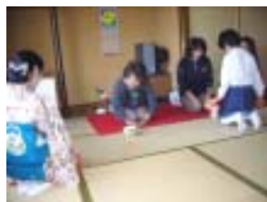
まなびっこフェスティバル