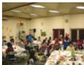
パーティーの始まりだぁ

本事業のメインとなる活動である。予め厨房業者と打合せをし、パーティーにふさわしいオードブルを提供してもらった。また、コーラスグループの「CAM」さんをお招きし、パーティーに華を添えていただいた。その後、みんなで作ったクリスマスケーキを食べたり、ピンゴ大会をしたりして、楽しいひと時を過ごした。