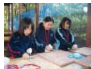
集中して作業しています

竹はし作りは、小刀を使用したか、怪我も無くスムーズに進めることができた。また、はし袋作り についても、講師が各班を巡回したりボランティアが小さい子ども達の手助けをしたりしながら行っ たため、全ての参加者が時間内に作製を終えることができた。