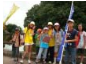
高岡古城公園にて