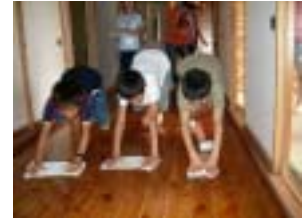
みんなで水ぶきだ！