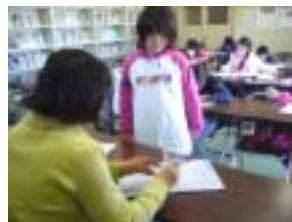
先生にチェックしてもらいます