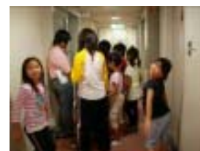
館内は迷路のよう