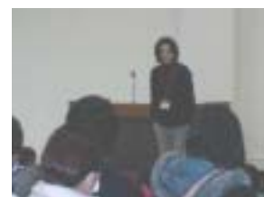
長谷先生(講師)の挨拶