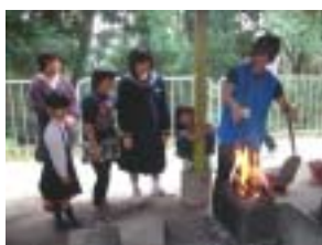
一斗缶オーブンで焼きます