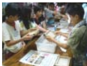
上手にできるかな

当館が所在している高岡市は、今年で開町400年を迎える記念の年であった。そのため、本事業としても、高岡の歴史を感じることをテーマに掲げた。この活動では、古来の紙作り技法である「紙すき体験」を行った。また、昨今の環境問題にも目を向け、エコな取り組みとするため、パルプの素材に牛乳パックを使用し、歴史を感じながら、同時に地球環境も考えられるような活動とした。