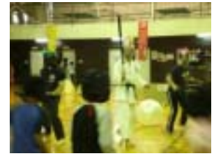
悪王子に負けるな！