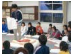
実際の布団を使って説明