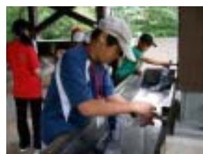
生活用の水を給水します