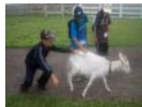
ヤギともふれあいました