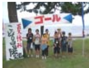
やっと海にたどり着きました