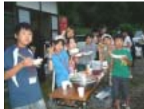
おいしくいただきました！