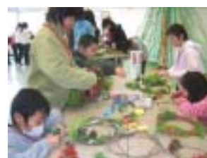
一生懸命に作りました

今回は、もう一品クラフト体験をしてもらった。キャンドルとともに家に持ち帰っても使ってもらえるものということで「リース作り」を行った。参加者は、自然のものを生かし、思い思いのリースを作っていた。