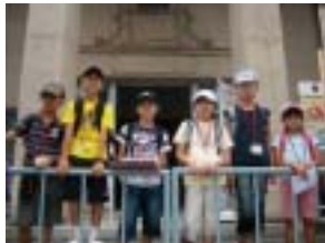
高岡市博物館にて