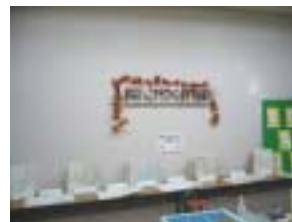
まなびっこフェスティバル