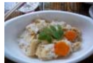
おいしそうに出来上がりました！