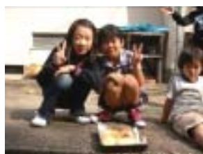
焼きあがりました！