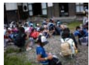
山寺に到着しました!