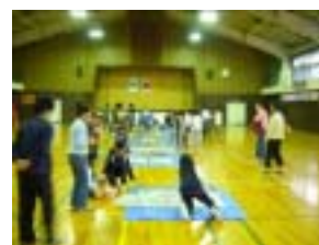
ロケットはうまく飛ばせたかな

地球温暖化などの環境問題で話題の二酸化炭素(以下、CO 2 )を取り上げた。まずは CO 2 の性質を調べ、その後工作活動に入った。工作では、入浴剤の入ったフィルムケースに水を入れて CO 2 を発生させ、ロケットのように飛ばすものである。実際に飛ばしながら “ どうしたら遠くまで飛ばすことができるか ” を考え、工夫を加えながら、科学への関心を深めた。