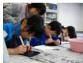
上手にできてるかな

平刀を使って、貝の上に残っている塗料を削り落とす貝むきの作業を行った。その後、みがき作業を行った。子どもたちは、最後の仕上げの作業ということでより丁寧にミニパネルの表面を磨き上げた。