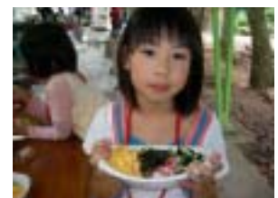
おいしそうにできました