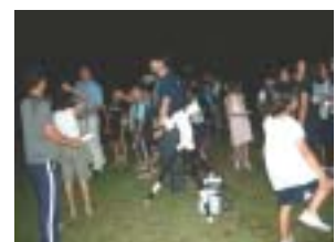
天体望遠鏡も覗きました