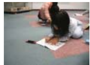
いつもありがとう