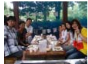
森の青空ランチの様子