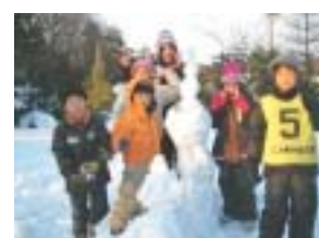
雪だるまと記念撮影