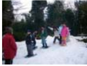
スノーシューで歩いたよ