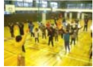
みんなでラジオ体操