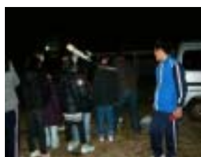
天体望遠鏡を覗きます

いつもお世話になっている富山県天文学会の皆さんに来ていただき、天体観察とその学習を行った。天体観測では、望遠鏡を覗かせていただいたり、星空を見ながら星の学習を行ったりした。また、観察中に人工衛星の通過を見ることができ、みんな感激をしていたようだ。その後、館内にて天体の様々な映像を見せていただき、星空への興味を深めた。